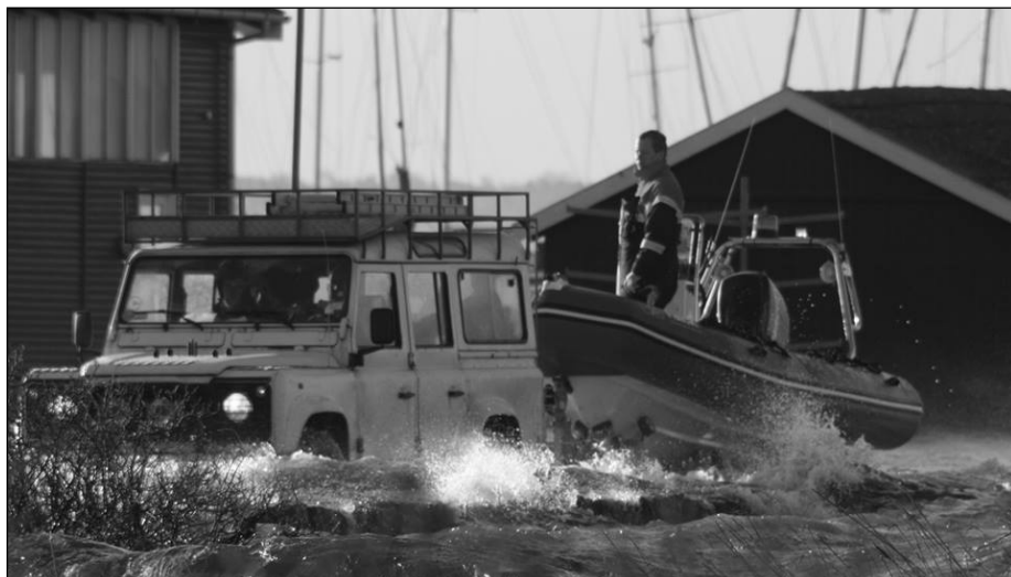
Under orkanen var Facebooksiden „For os der bor på Orø” stedet med de seneste nyheder.

Mere end 460 personer bruger hjemmesiden „For os der bor på Orø” på Facebook. Her udveksles daglige informationer om løse kænguruer, kattekillinger til salg, synspunkter om vejret og alt godt fra havet. Men siden er også til alvor: Da orkanen Bodil hærgede øen, spillede