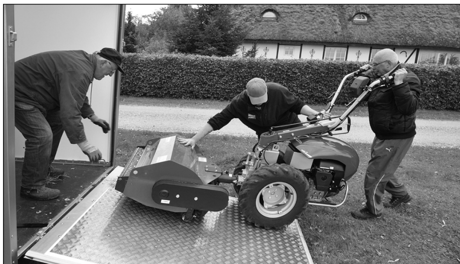
Nyt grej tages i brug for første gang.

hjemmesiden en hovedrolle, da borgerne selv tog hånd om vejrkatastrofen. Her blev annonceret overnatning for beboere i nød, her meldte man om væltede træer. På bladets midtersider kan du se billeder af øens dygtige reddere – det er billeder hentet fra „For os der bor på Orø”.