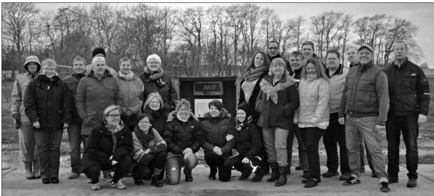
Det meste af slankegruppen på kornvægten i januar.