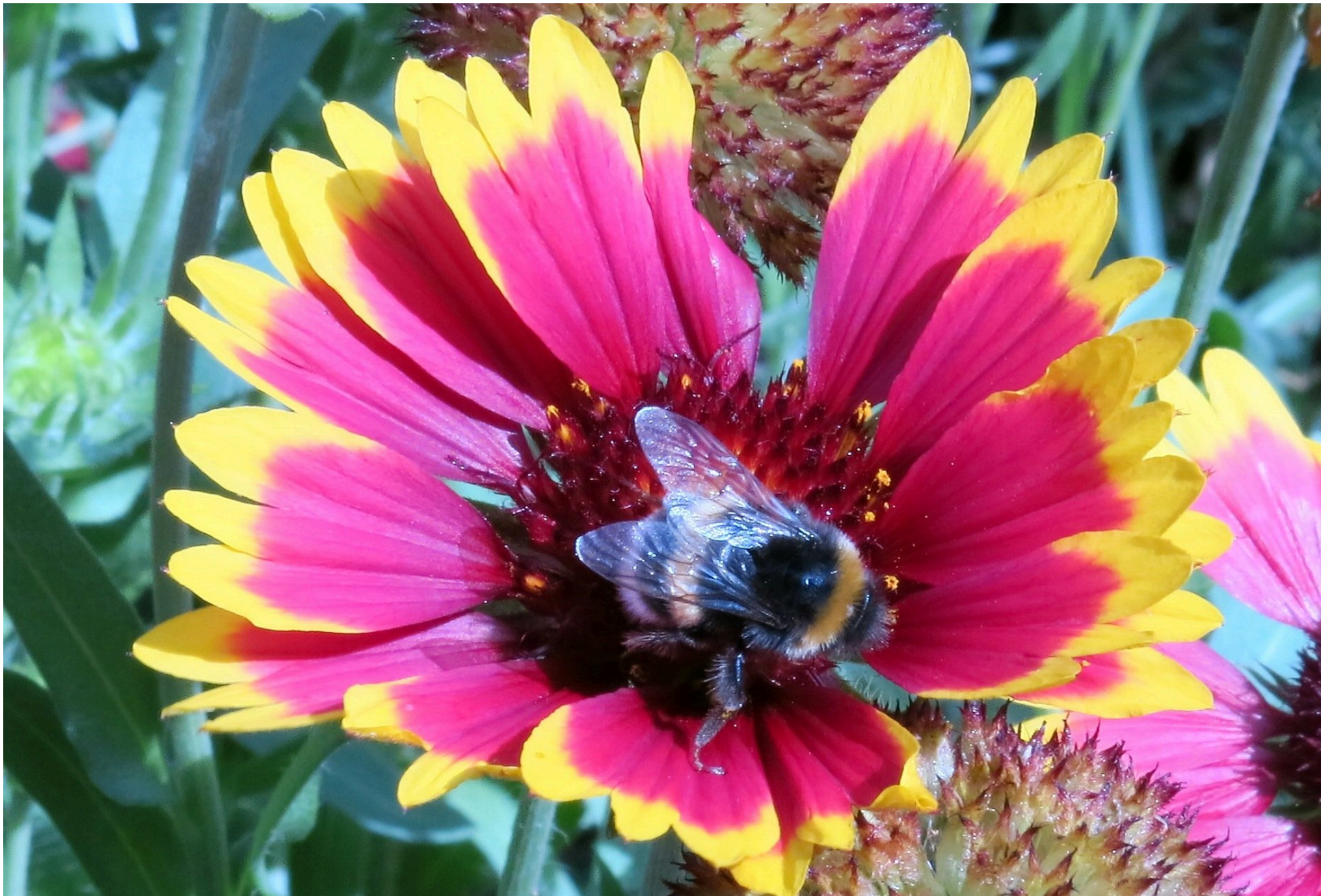
Humlebi i blomst.