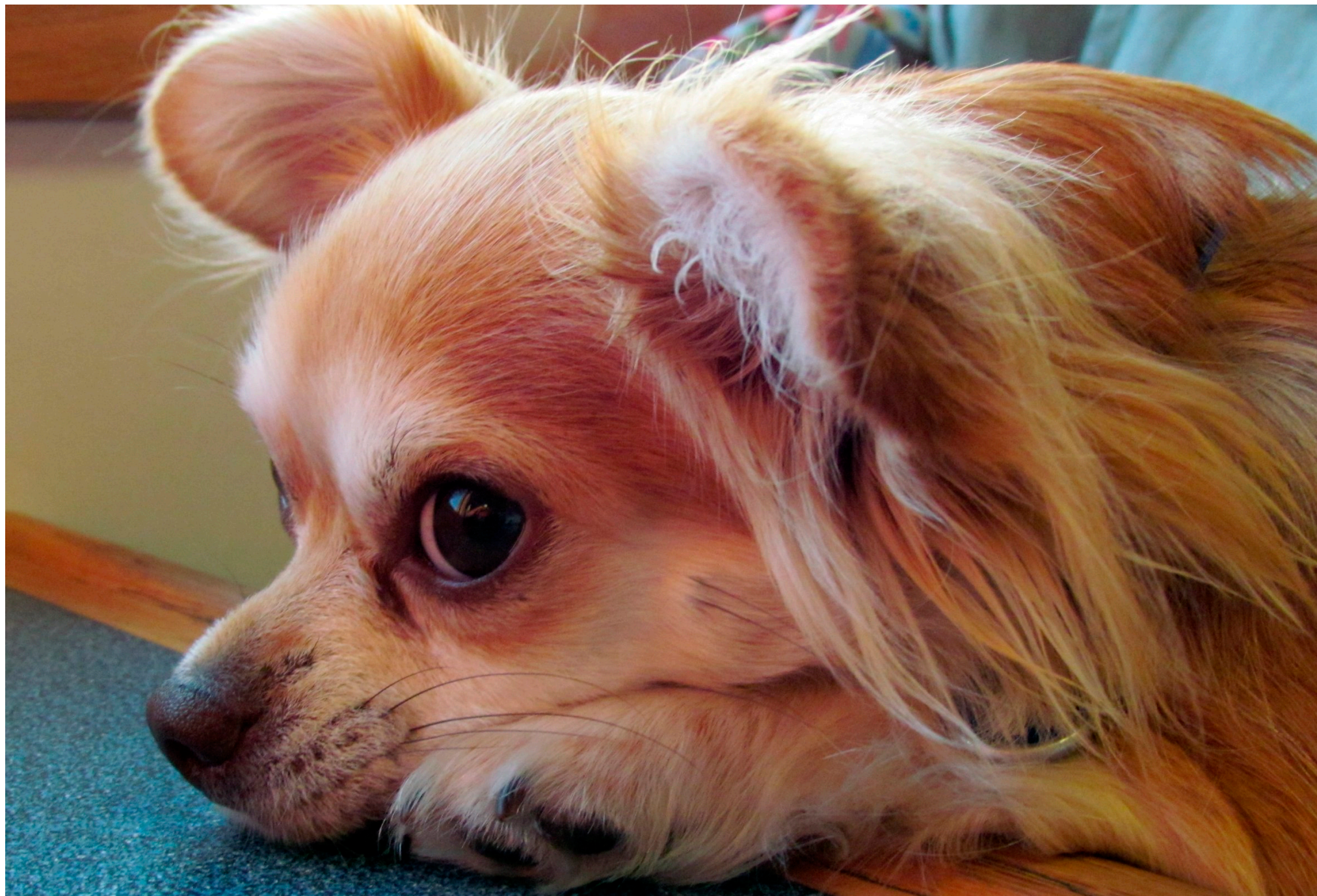
Hunden Kofi.