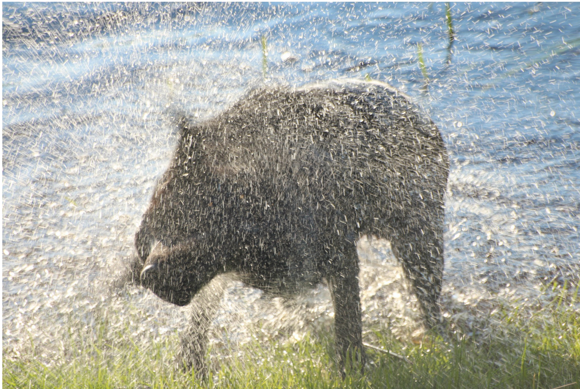
Hund der ryster sig.