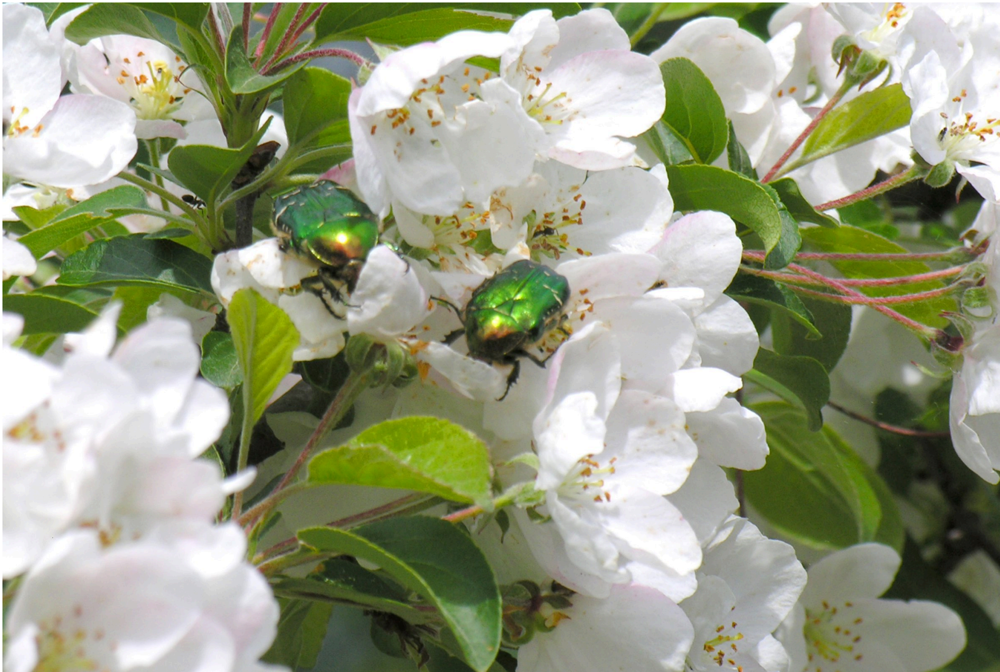
To guldbasser.