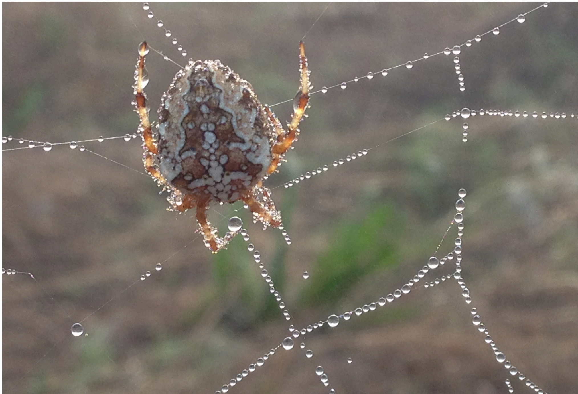
Edderkop med dugperler.