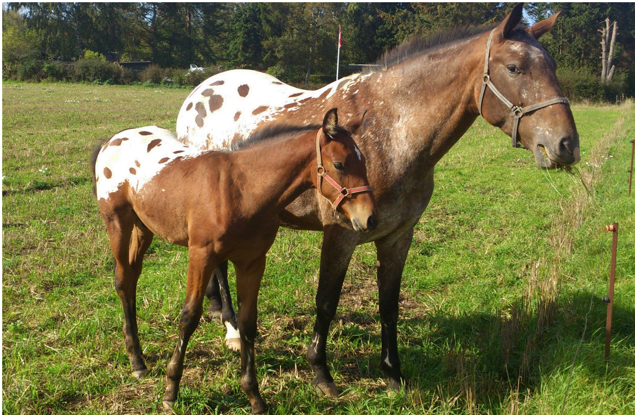
Hoppe med føl.