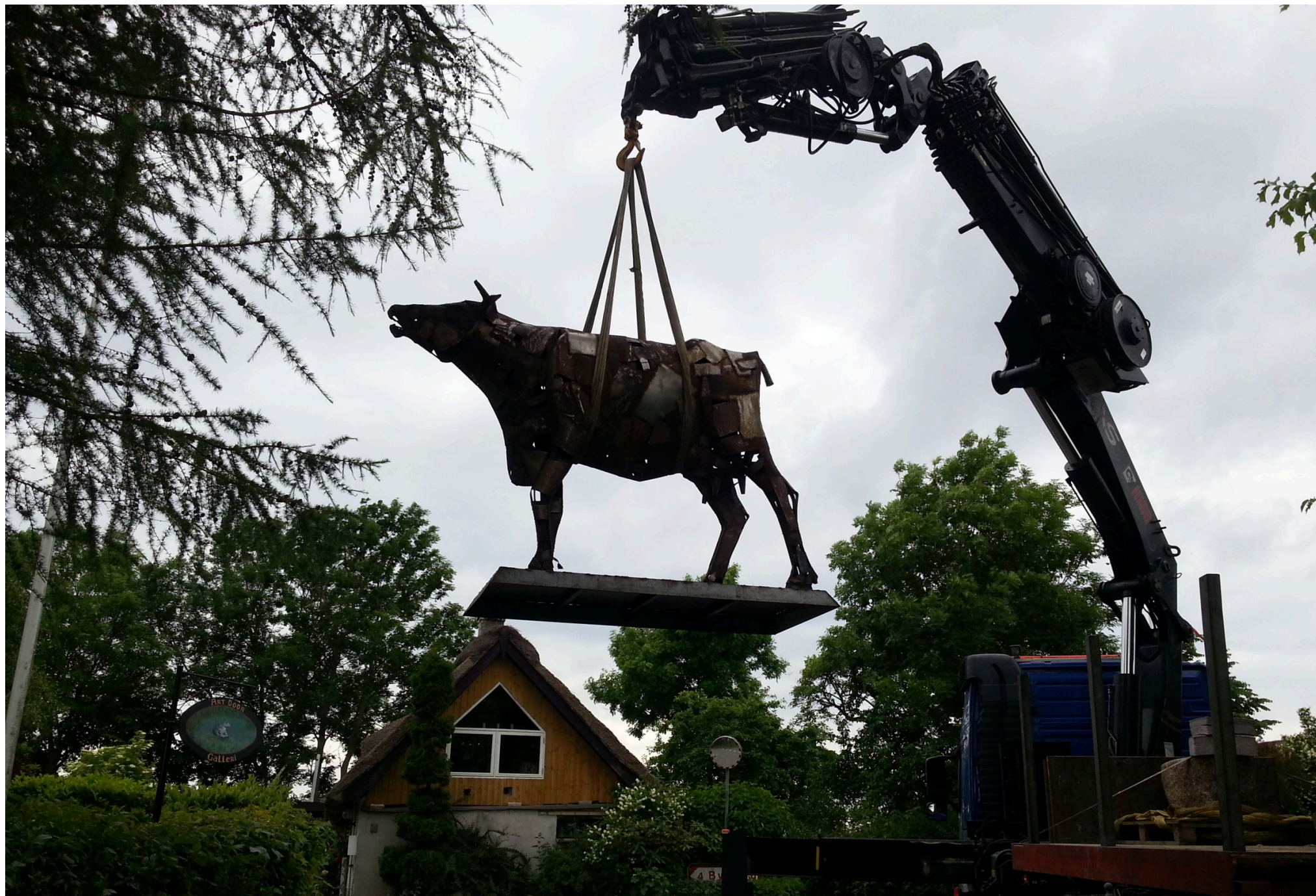
Hellig ko Peter.