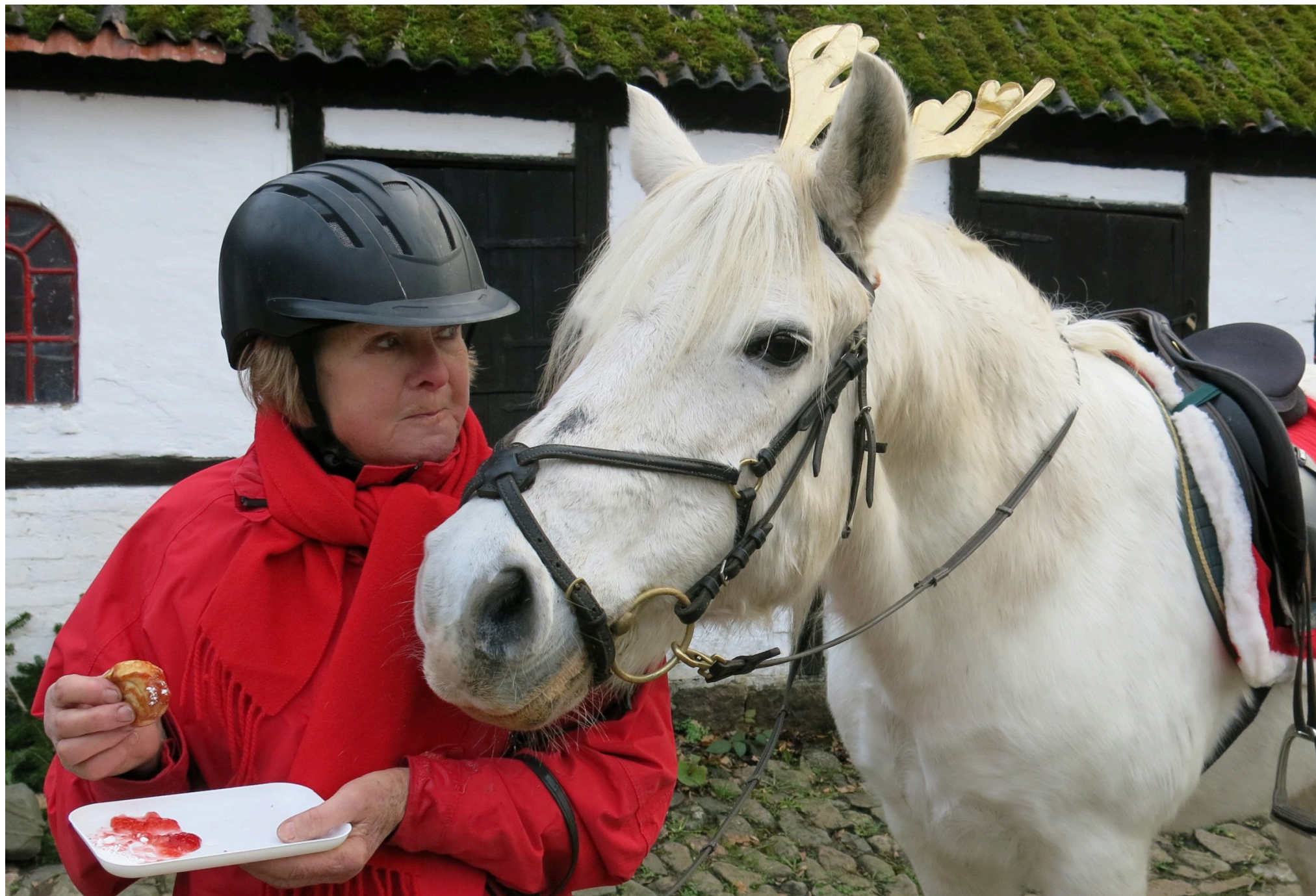
Næ, næ, du har fået.