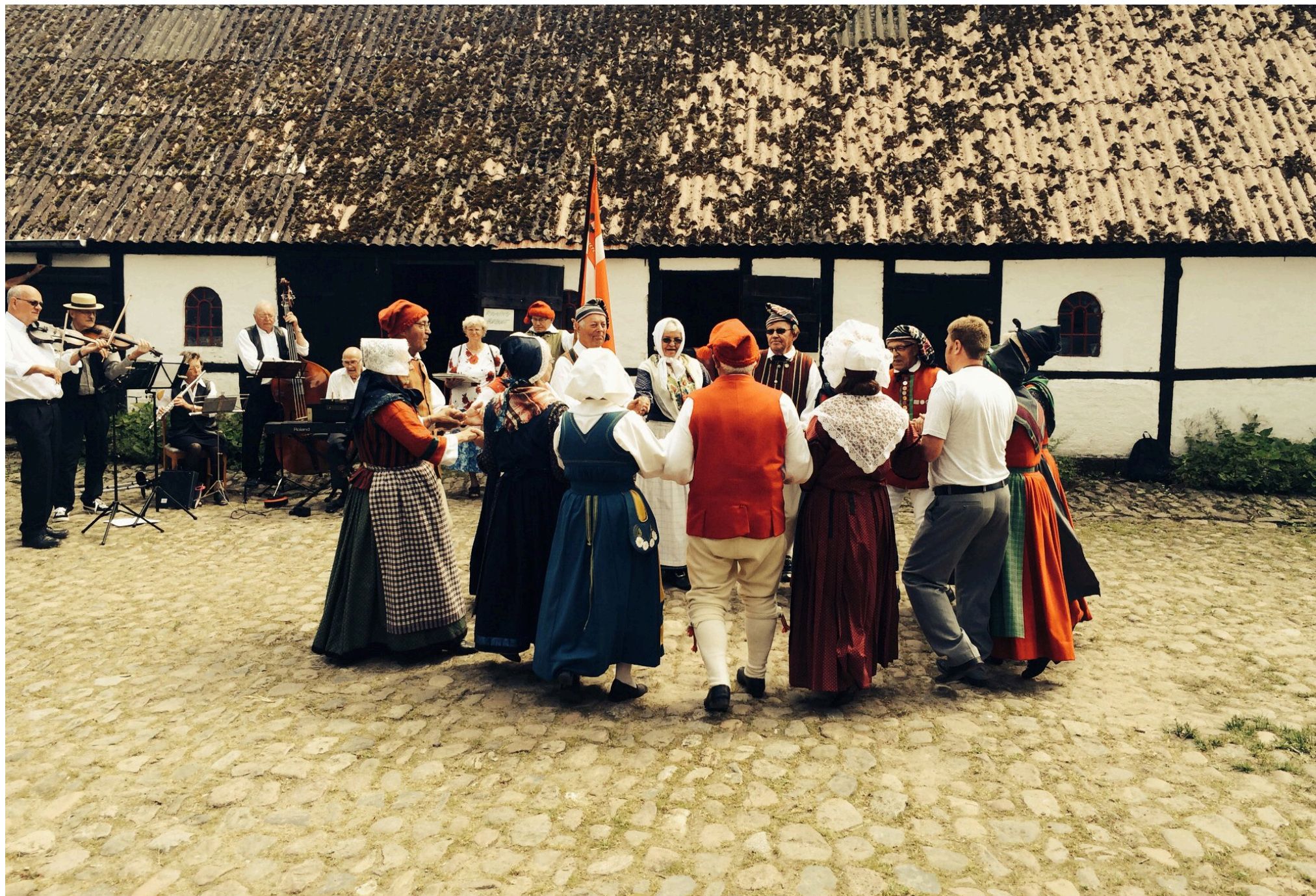
Folkedans på Hestebedgaard.