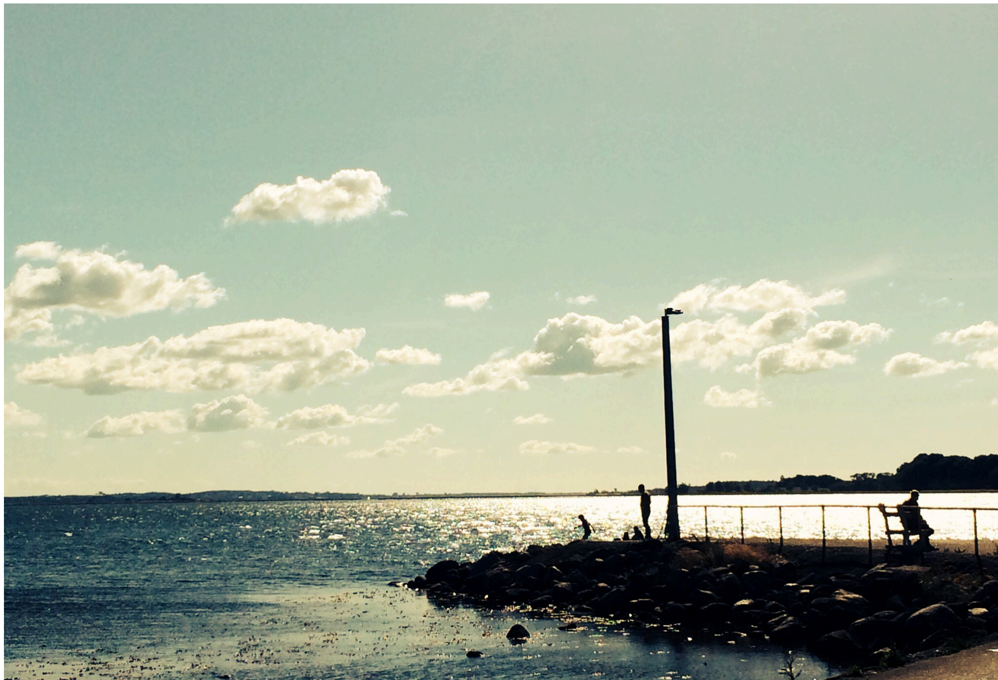
Molen ved Hammer Bakke.