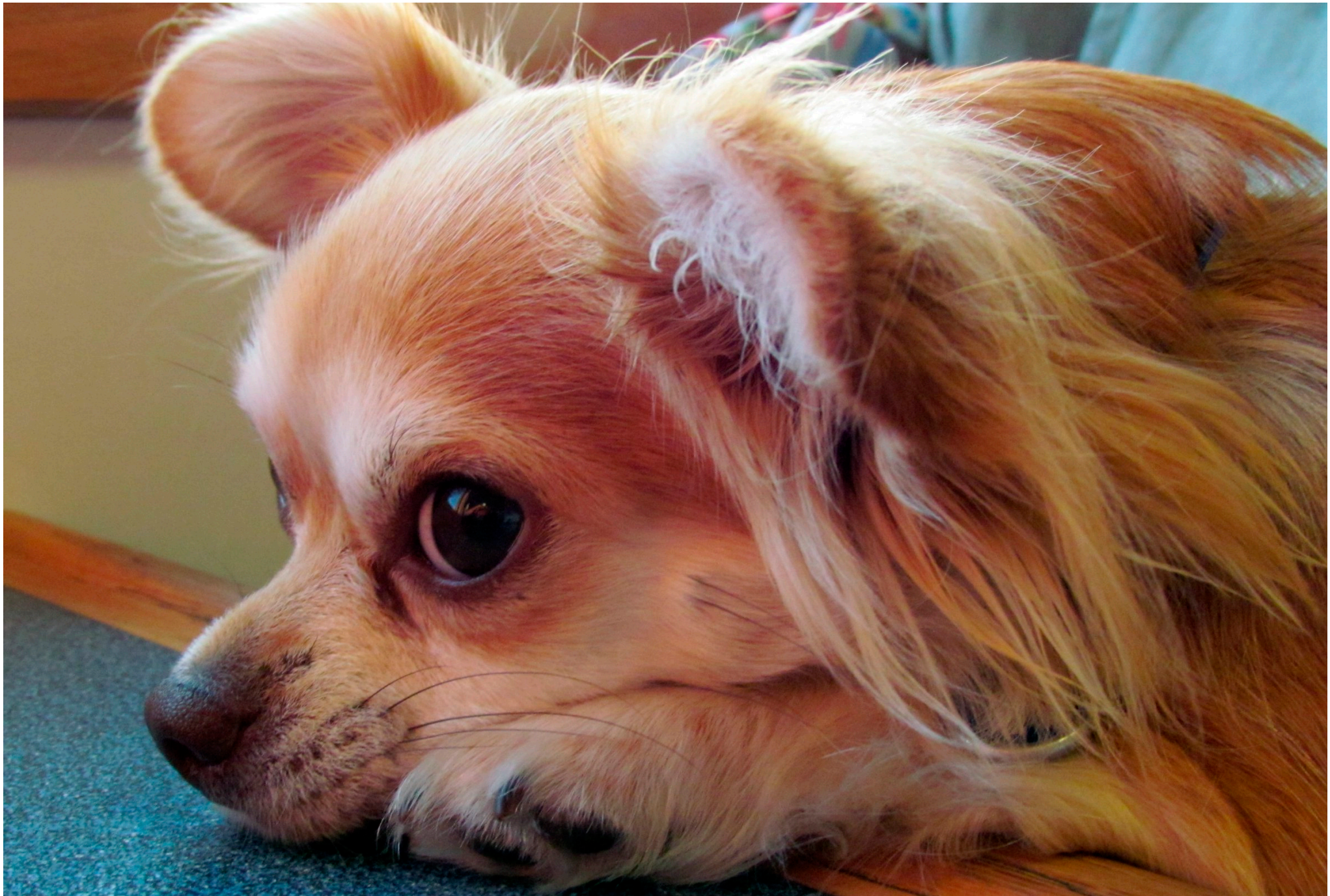
Hunden Kofi.